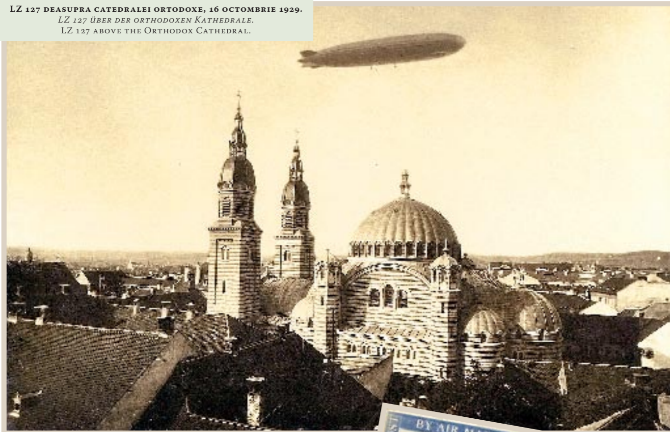
LZ 127 DEASUPRA CATEDRALEI ORTODOXE, 16 OCTOMBRIE 1929. LZ 127 ÜBER DER ORTHODOXEN KATHEDRALE. LZ 127 ABOVE THE ORTHODOX CATHEDRAL.