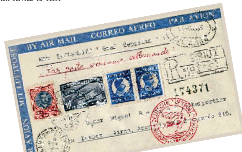
ILUSTRATE „PRIN AVION”, ÎN FAPT „CU AERONAVA GRAF ZEPPELIN”, CU DESTINAȚIA BUENOS AIRES (PLECATE DIN „SIBIU” LA 9 MAI 1934, APOI DIN FRIEDRICHSHAFEN LA 26 MAI 1934). ANSICHTSKARTEN „VIA FLUGZEUG”, EIGENTLICH „MIT DEM LUFTFAHRSCHEIF GRAF ZEPPELIN”, ZIELORT BUENOS AIRES (ABFLUG IN HERMANNSTADT AM 9. MAI 1934, ANKUNFT IN FRIEDRICHSHAFEN AM 26. MAI 1934). PLANE POSTCARDS, ACTUALLY „WITH GRAF ZEPPELIN AIRCRAFT” WITH THE BUENOS AIRES DESTINATION (LEFT FROM SIBIU ON MAY 9, 1934 AND AFTER THAT, FROM FRIEDRICHSHAFEN ON MAY 26, 1934).

În august 1929 a efectuat primul zbor în jurul lumii, în 21 de zile, 5 ore și 31 minute (8-29 august, Lakehurst, New Jersey/SUA). În 1931 dirijabilul a zburat peste Oceanul Arctic.