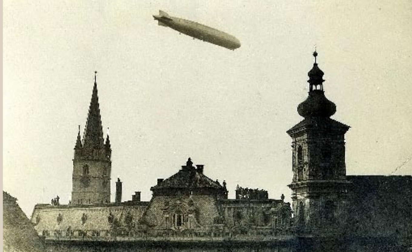
LZ 127 URMĂRIT DE PE ACOPERIȘUL BĂNCII CREDITULUI FUNCİAR DIN PIAȚA MARE, 16 OCTOMBRIE 1929. LZ 127 BEOBACHTET VOM DACH DER BODENKREDITANSTALT AM GROSSEN RING. LZ 127 SEEN FROM THE ROOF OF THE FINANCIAL CREDIT BANK FROM THE BIG SQUARE.