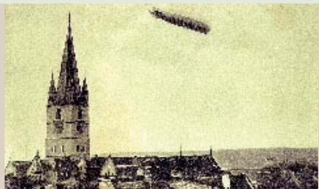
LZ 127 DEASUPRA BISERICII EVANGHELICE, 16 OCTOMBRIE 1929. LZ 127 ÜBER DIE EVANGELISCHE STADTPFARRKIRCHE. LZ 127 OVER THE EVANGELICAL CHURCH.

Zur Zeit seines Rückzugs ist der Graf Zeppelin über 1,6 Millionen km geflogen (1 Million Meilen) in 590 Fahrten (144 Atlantikdurchquerungen), über 13000 Passagiere befördernd. Zeppelin wurde einen Monat nach dem Sturz des Kleinluftschiffs LZ 129 Hindenburg (6 Mai 1937) aus dem Verkehr gezogen. Im März 1940 verfügte Hermann Göring, der deutsche Reichsminister der Luftfahrt, die Zerstörung aller verbliebenen Kleinluftschiffe und die Verwendung des daraus gewonnenen Aluminiums in der deutschen Kriegswirtschaft.