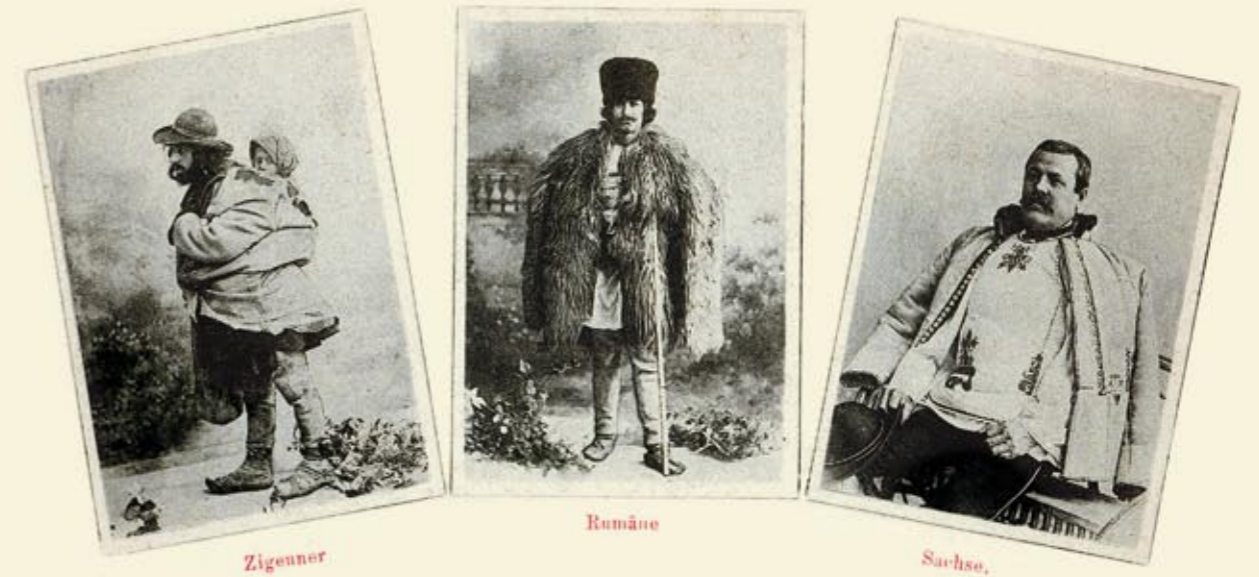
Țigan, român și sas, [1900]. A Gipsy, a Romanian and a Saxon.