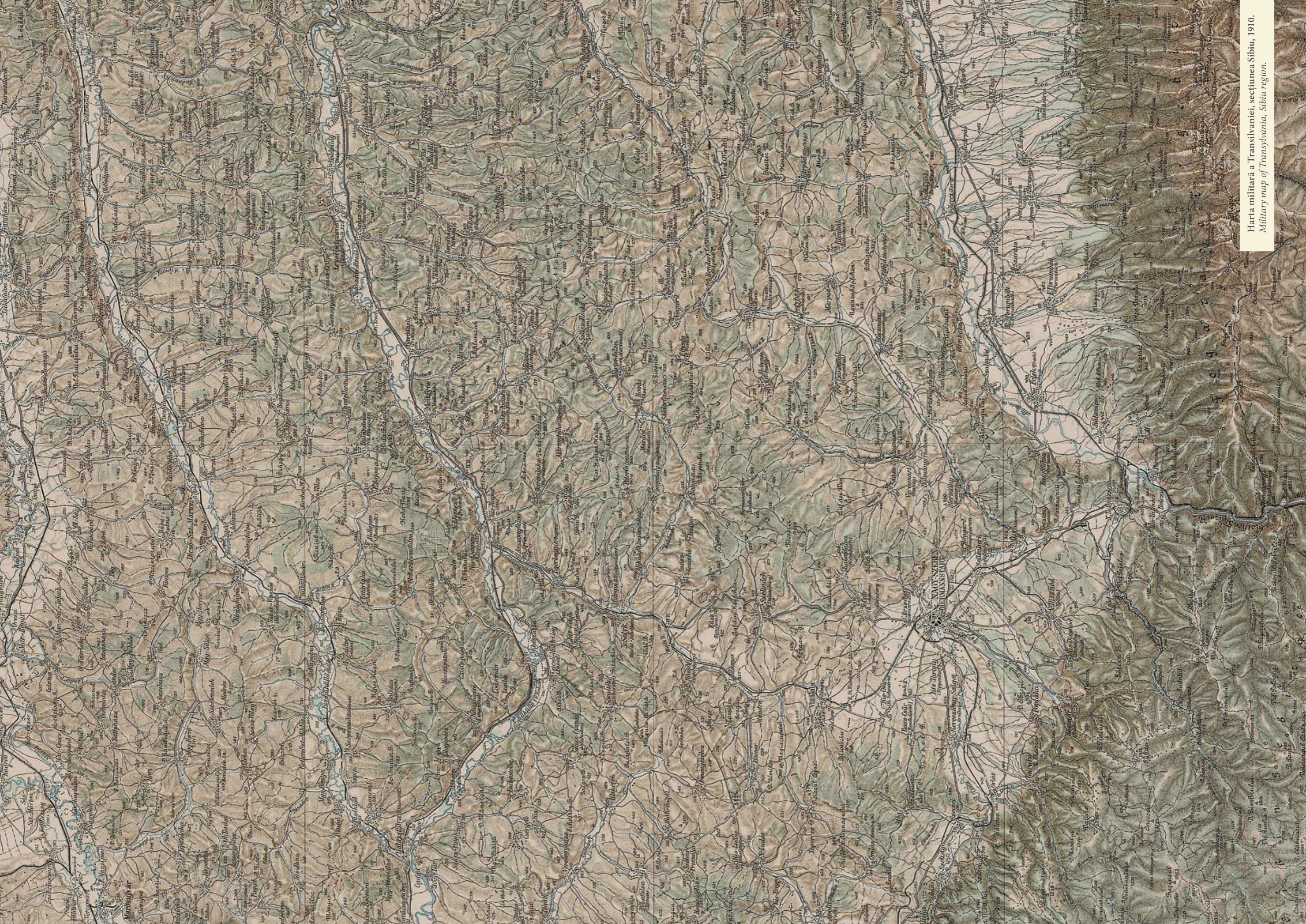
Harta militară a Transilvaniei, secțiunea Sibiu, 1910. Military map of Transylvania, Sibiu region.