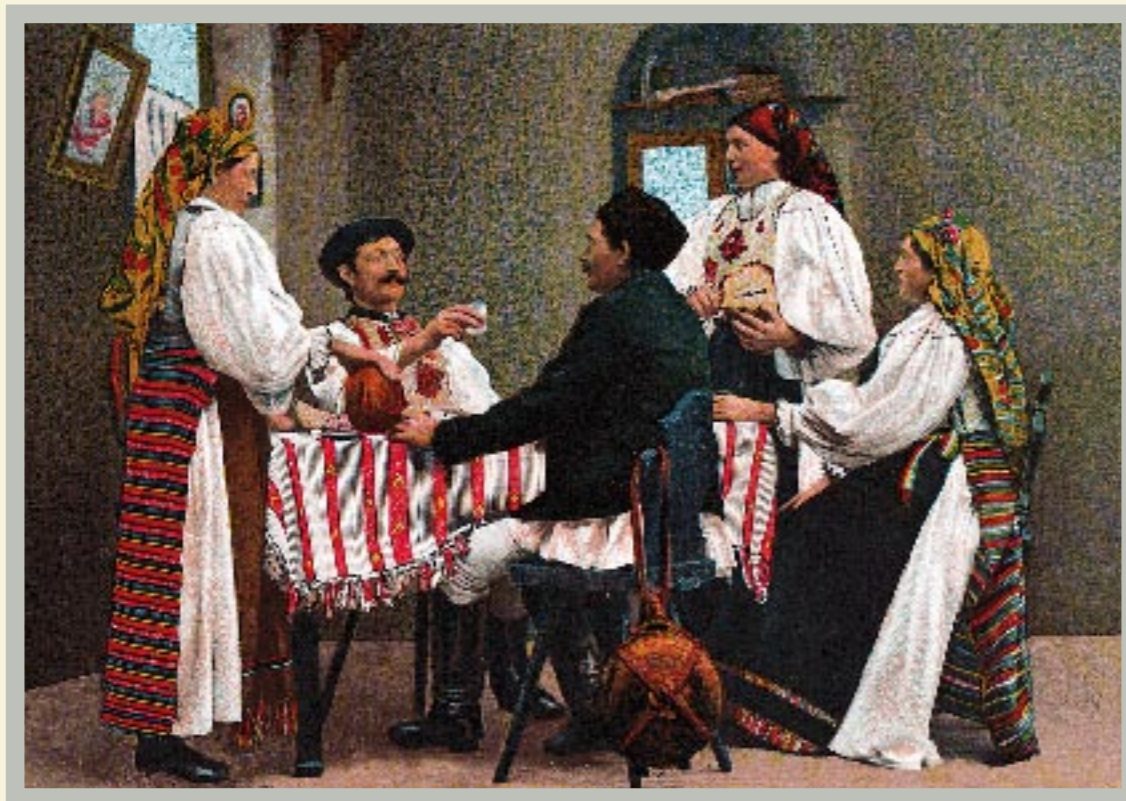
Țărani români din Sibiu, 1905. Romanian peasants in Sibiu.