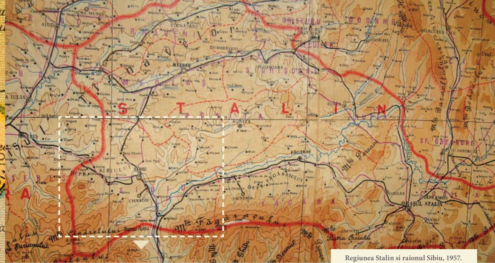
Regiunea Stalin și raionul Sibiu, 1957. The region Stalin and the rayon Sibiu.