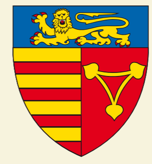
Sibiu County. History and Old Pictures