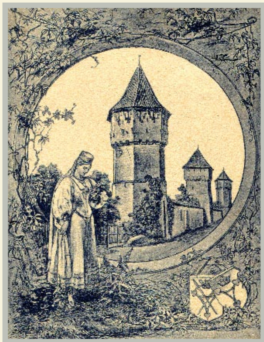
Sibiancă în port săsesc pe strada Harteneck (Cetăţii), [1900]. Saxon woman from Sibiu on the Hartenek Street.