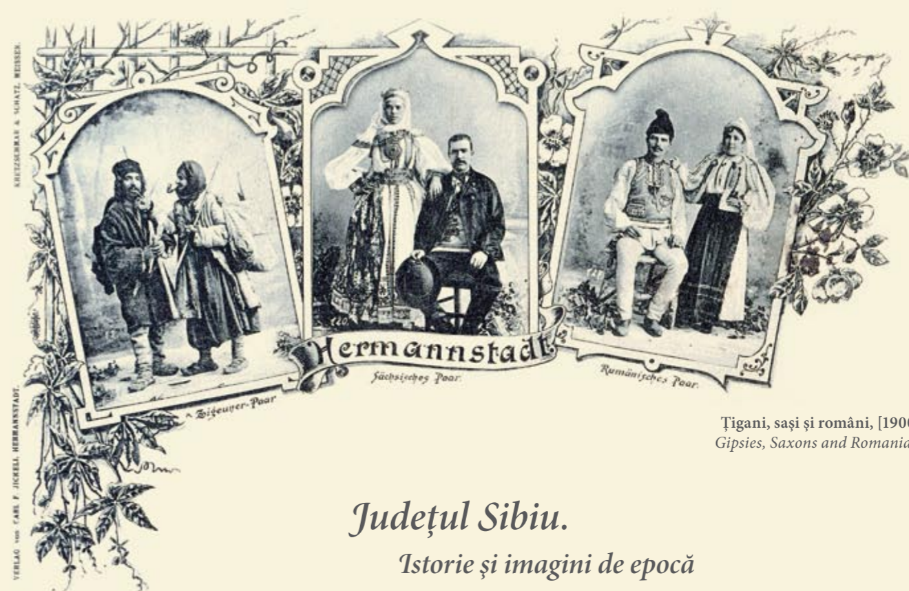
Țigani, sași și români, [1900]*. Gipsies, Saxons and Romanians.