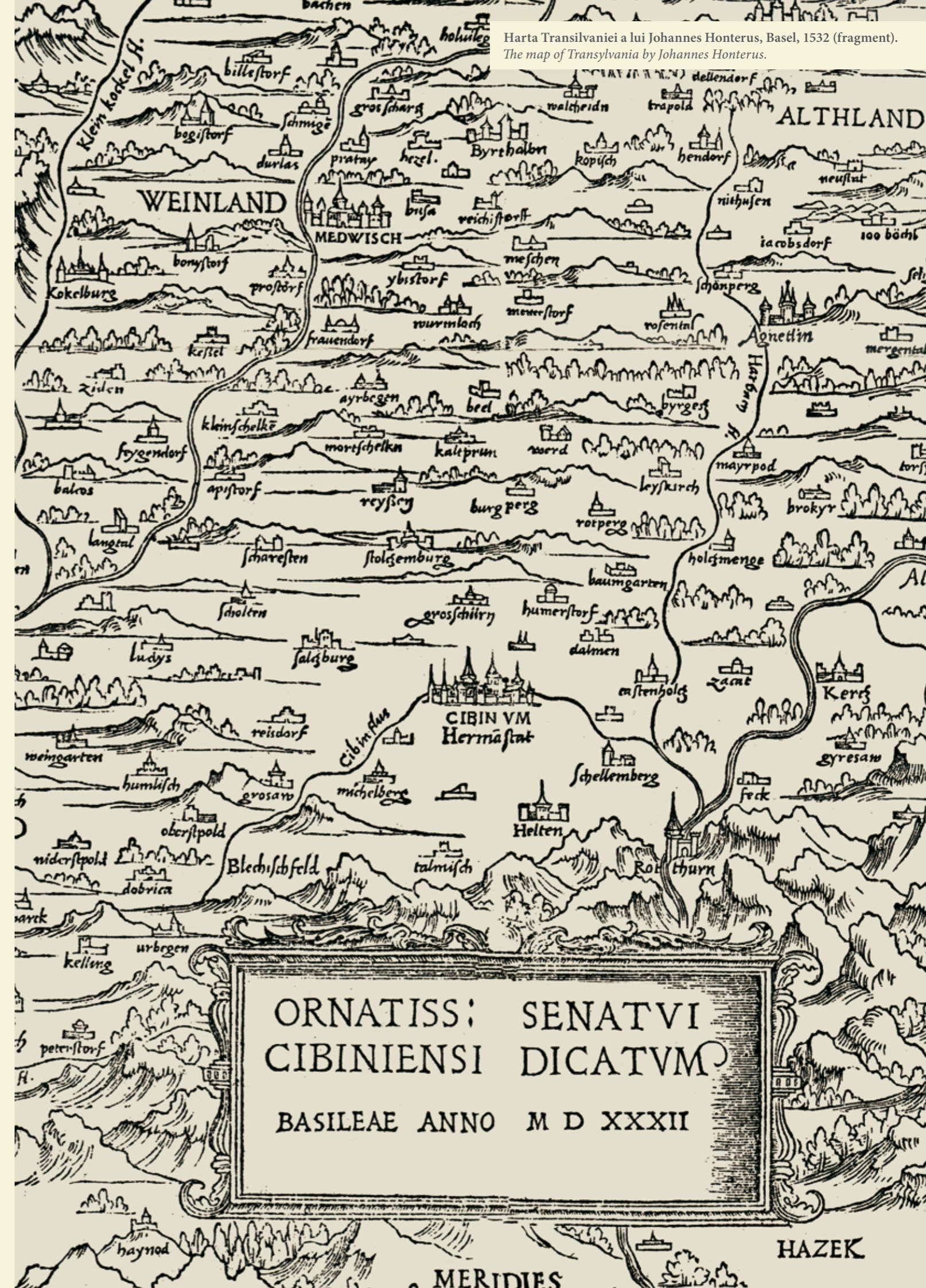
Harta Transilvaniei a lui Johannes Honterus, Basel, 1532 (fragment). The map of Transylvania by Johannes Honterus.