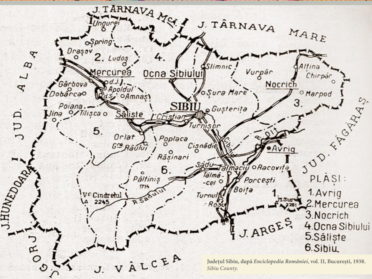
Județul Sibiu, după Enciclopedia României , vol. II, București, 1938. Sibiu County.